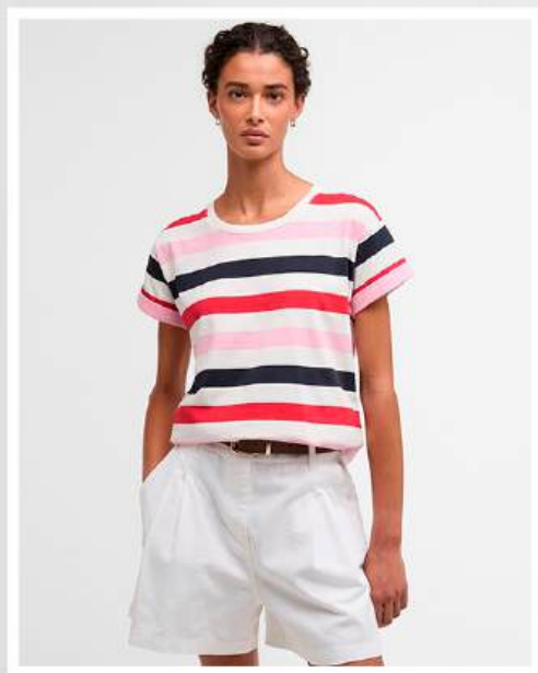
BARBOUR T-Shirt Lyndale

Perfekt für den Sommer ist dieses feminine Outfit von Aniston Casual und Paul Green. Das luftige Blusentop von Aniston CASUAL besticht durch seinen großflächigen, farbharmonischen Blätterdruck – jedes Teil ein Unikat. Der figurbetonte, ärmellose Schnitt aus weich fallender Viskose sorgt für hohen Tragekomfort und eine elegante Silhouette. Dazu die lässige Bootcut-Jeans von Aniston Casual mit ausgestelltem Bein, die durch ihre hochwertige Baumwollmischung, die klassische 5-Pocket-Form und den femininen Schnitt überzeugt. Abgerundet wird der Look durch zeitlos-elegante Sandalen von Paul Green aus weichem Leder mit verstellbarem Riemchen und bequemer Sohle – für stilvollen Komfort den ganzen Tag.