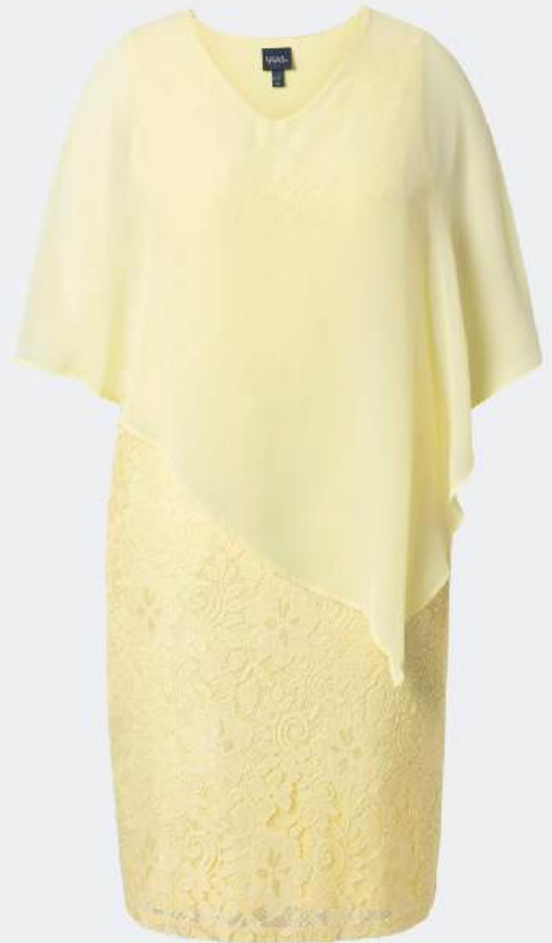
ULLA POPKEN Abendkleid Spitzenkleid