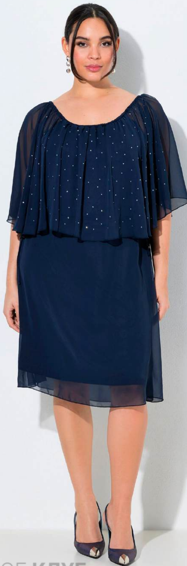
ULLA POPKEN Cocktailkleid Kleid