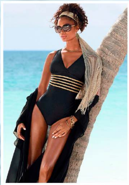
LASCANA Badeanzug Elodie