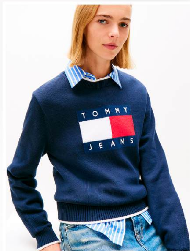
TOMMY JEANS Strickpullover TJW

Entdecke den vielseitigen Strickpullover «TJW TIPPING FLAG SWEATER EXT» von Tommy Jeans. Der lockere, hüftlange Schnitt aus weicher Baumwolle garantiert dir warmen und bequemen Tragekomfort für jeden Tag. Ob lässig zu Jeans und Sneakern oder feminin zum Midi-Rock kombiniert – dieser kuschelige Basic-Pulli ist das perfekte Highlight für deine Freizeitgarderobe.